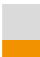
½ strany 210×95 mm horizontálně