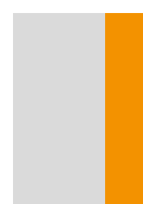
½ strany 70×285 mm vertikálně