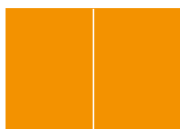
Dvoustrana 420×285 mm