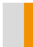
1/3 strany 70×270 mm vertikálně