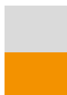
1/2 strany 200×133 mm horizontálně