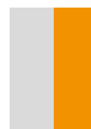
1/2 strany 98×270 mm vertikálně

Podklady dodávejte ve formátu PDF, EPS, nebo TIFF s grafikou v rozlišení minimálně 300 dpi. Všechny grafické podklady musejí být v barevném prostoru CMYK. Inzerce musí obsahovat spádavku v délce minimálně 3 mm na každou stranu. Inzerát by neměl obsahovat důležité informace a texty blíže než 5 mm k okrajům. PDF soubory dodávejte bez zabezpečení. Vydavatel neručí za chyby tisku v důsledku nedodržení těchto podmínek.