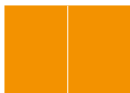
Dvoustrana 400×270 mm