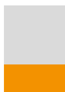
1/3 strany 200×87 mm horizontálně